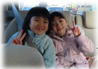
早く着かないかな あ〜と車の中で

11月18、19日のお泊り会ではご協力いただきありがとうございました。 沢山の思い出ができました。