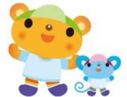
お部屋でも運動会ごっこ

はらぺこあおむしに変身♥マットのお山を昇ったり、果物のトンネルをくぐり抜けたり、羽根つきの箱に乗ったり、初めての運動会を楽しみました♪