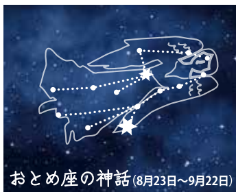
おとめ座の神話(8月23日~9月22日)

お お く ら あ き お 大倉 秋雄さん た て お か 館岡 ますみさん す み た ら ん 住田 蘭さん ①さんさ ②享楽