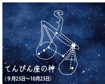
てんびん座の神 (9月23日~10月23日)

てんびん座に描かれている天秤は、大神・ゼウスと女神・テミスの間に生まれた女神・アストレアの持つ天秤だとされています。ギリシャ神話では、アストレアは正義の女神として描かれていて、剣と天秤を手にしています。その天秤で死者の魂を量り、悪に傾いたものを冥界におくる役目を果たしていたと伝えられています。