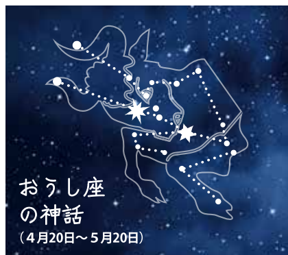
おうし座の神話 (4月20日~5月20日)